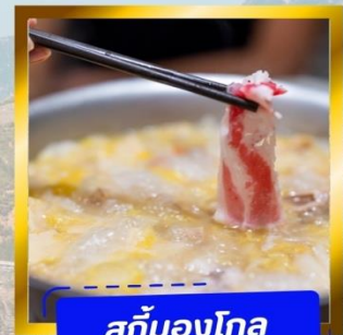
สุกั่มองโก