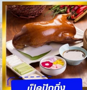
เปิดปักกิ่ง