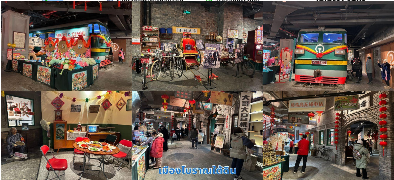
เมืองโบราณใต้ดิน

ขับเคลื่อนด้วยไฟฟ้ารุ่นแรกในจีน เป็นจุด เช็กอินใหม่ให้ท่านได้เลือกถ่ายรูป